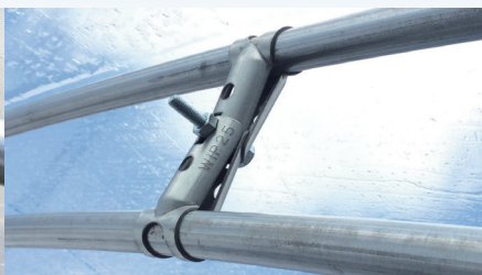
新型 W インパクト