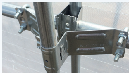
新型トラスインパクト